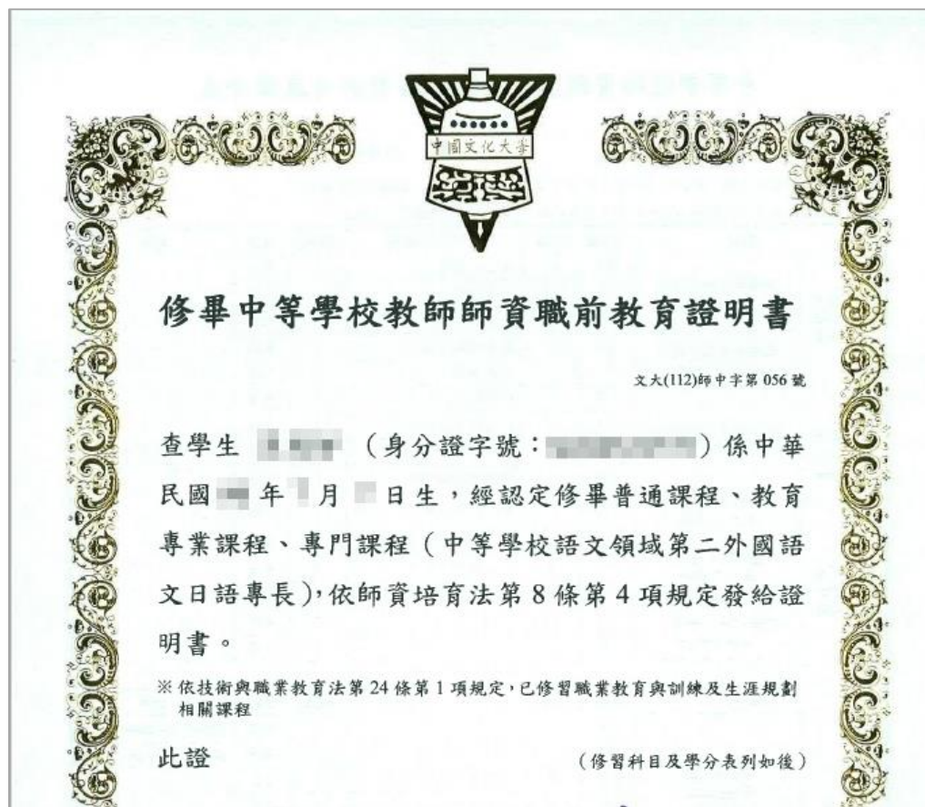
新制格式（先檢後實）